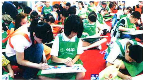
作为全球领先的化工公司，巴斯夫首创了一项重要的教育活动——“巴斯夫小小科学家”。第七届“巴斯夫小小科学家”北京开幕式在中国科技馆举行。

12 家上榜的本土企业中，宝钢在原材料行业中综合排名第一，五矿集团紧随其后。宝钢在环境管理体系建设方面尤其突出。它是中国冶金第一家获得 ISO14001 环境管理体系认证的企业，而且建立了全面的内控体系，以做好节能工作。此外，宝钢在供应链管理中同样融入环保理念，公司的绿色采购政策能有效评估供应商的环境管理体系。今后，宝钢还计划将绿色采购作为一个指标放入管理绩效评估。