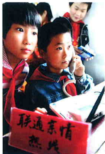
灾区儿童通过中国联通的“亲情热线”向在外打工的父母报平安。

在本榜单中,联想集团是中国本土民营企业的表率。早在2004年并购IBM个人电脑业务以前,联想集团就已致力于开发绿色产品,至今已有将近十年之久。2002年的Kaitian 6800个人电脑,制造所需的塑料和硬件材料仅为传统个人电脑的不到50%,开创了个人电脑的极简设计。2005年,所有联想商用产品均达到中国节能标准,成为公司发展历程中的又一座里程碑。2007年,联想以其ENERGY STAR™项目为基础,开发了一系列符合美国EPA ENERGY STAR™标准要求的笔记本电脑和台式电脑。目前,联想Think Centre A61e是世界上最小巧、最节能的台式电脑,并已获得多项环境成就大奖。