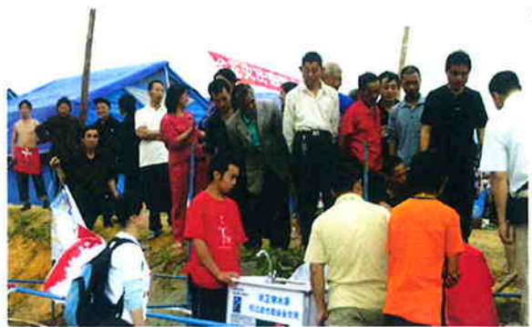
2008年，3M公司得知四川灾区极度匮乏干净的饮用水供应时，当即决定伸出援助之手，向灾区捐赠100台3M流动饮用水站。

工业覆盖面很广，包括电器设备制造、工业工程建设、工业运输，等等。16家工业企业上榜，其中9家为本土企业，7家外资企业。由于存在较高程度的污染水平，工业也被列入高耗能、高污染行业。